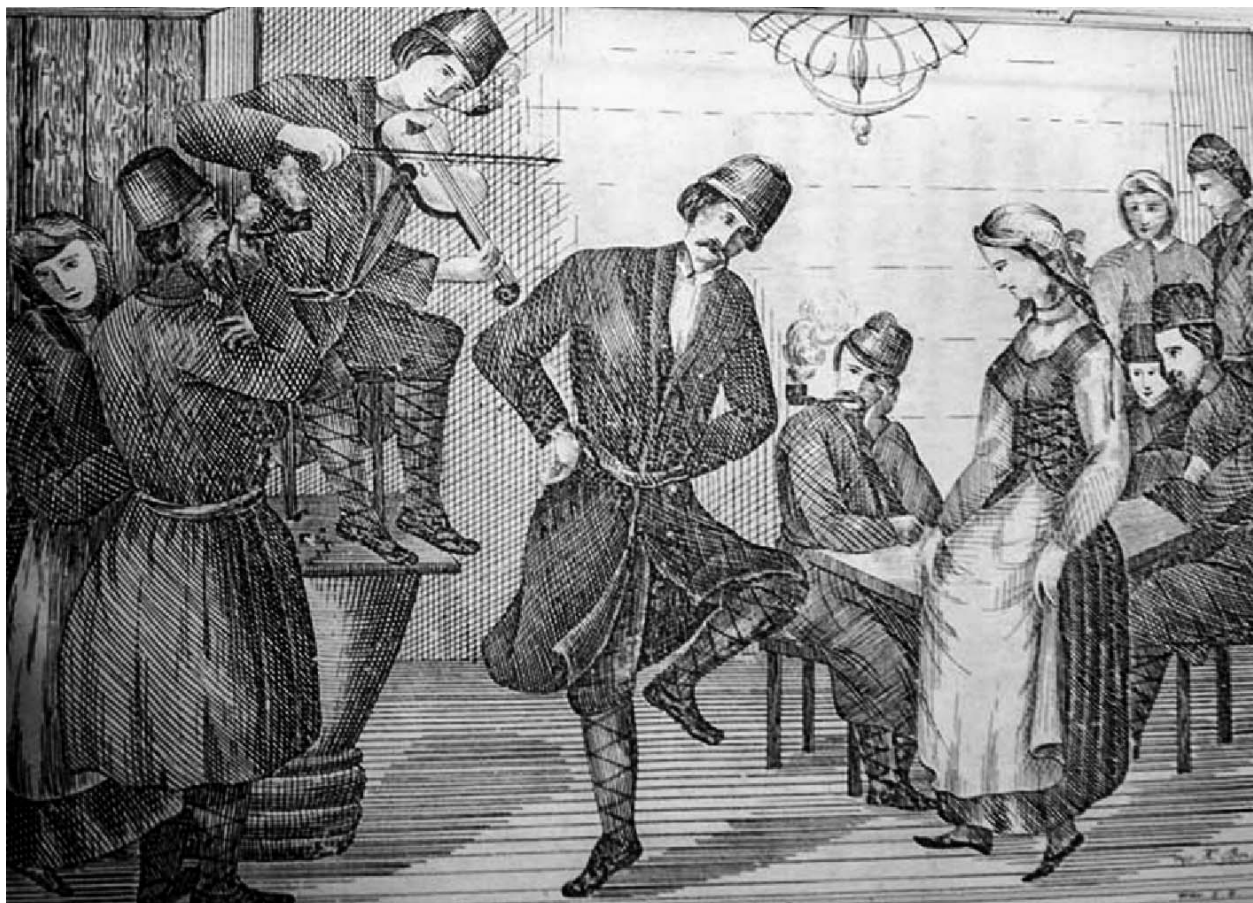
Ілюстрацыя да «Гапона» (1855) В. Дуніна–Марцінкевіча.

ве схіленую на бок маргелку — галаўны ўбор, які, трэба думаць, падкрэсліваў яго статус не абы-якога кавалера.