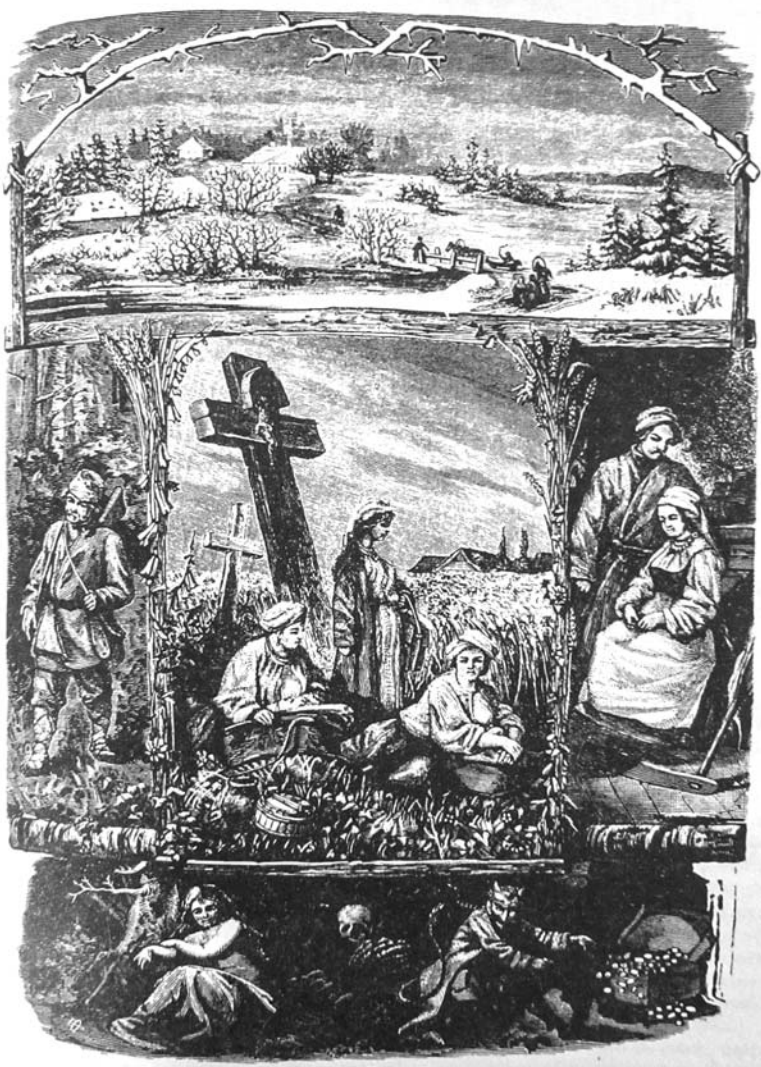
Сцэны з жыцця беларусаў XIX стагоддзя.

Пачнем з камедыі Марцінкевіча «Ідылія» (1846). У ёй галоўная гераіня шляхцянка Юлія паўстае як маладая амбіцыйная авантурыстка. Яна збіраецца перавыхаваць свайго кузэна-франкамана, зрабіць яго патрыётам і апекуном падданных сялян, а пры выпадку, і сваім мужам. Паводле патрабаванняў да дзяўчыны свайго сацыяльнага статусу, яна ў прынцыпе не павінна пагаджацца на спатканне з мужчынам у начным садзе, тым больш сама прызначаць такія сустрэчы, у тым ліку жанатым мужчынам. У першай палове стагоддзя часта нават выключаліся размовы пра пачуцці паміж высакародным маладым чалавекам і дзяўчынай-шляхцянкай, тым больш сам-насам і ўначы, бо гэта кампраметавала паненку. У дзяўчынак з маленства выхоўваліся такія дабрачыннасці, як цнота, сціпласць і набожнасць. Напрыклад, шляхцянец шмат што забаранялася: адной выходзіць куды-небудзь з дому, заставацца сам-насам з нежанатым мужчынам, у гасцях шмат і гучна гаварыць і інш.